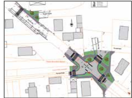
La sécurisation du carrefour dans la rue du Rhin

Le conseil municipal a décidé de mener un programme de travaux de voirie pour l'année 2025 et d'inscrire les crédits nécessaires au budget. Ces travaux ont été priorisés suite à des diagnostics résultants de trois études : relatives à la voirie communale, l'éclairage public et la sécurité routière dans la rue du Rhin.