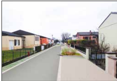
L'aménagement futur de la rue des Pâquerettes