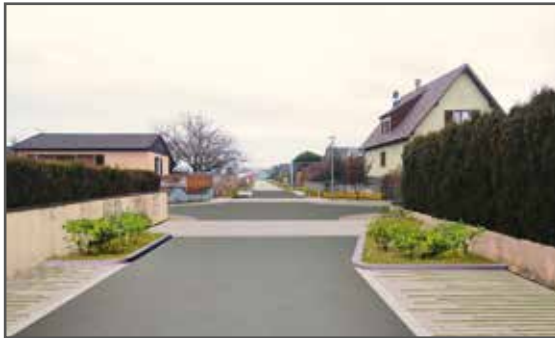
L'aménagement futur de la rue des Jonquilles