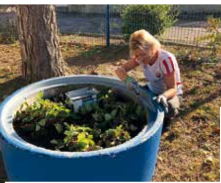
REPEINDRE LES BACS POTAGERS À L'ÉCOLE MATERNELLE