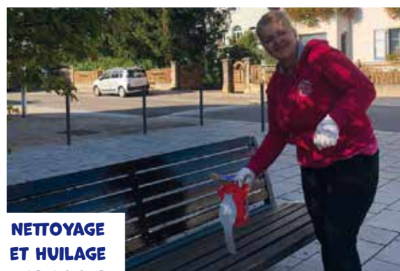
NETTOYAGE ET HUILAGE DES BANCS DU VILLAGE RUE PRINCIPALE