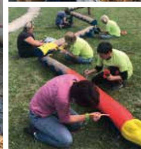
LASURE DES JEUX SUR L'AIRE DE JEUX ET DE LA RAMBARDE DE L'ESCALIER AU PÉRISCOLAIRE