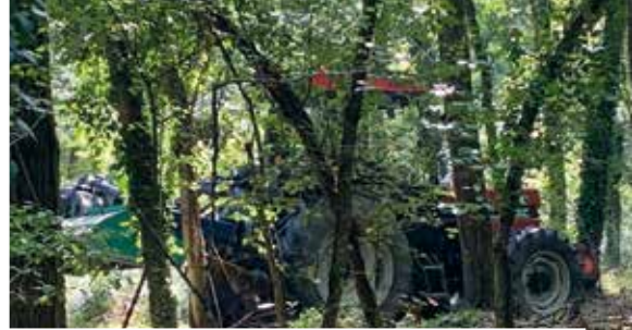
ENTRETIEN, ÉLAGAGE, RÉPARATION DU PARCOURS DE SANTÉ, DU CHEMIN DERRIÈRE LA STATION D'ÉPURATION ET AUTOUR DES PONTS VERS LE MOULIN ET DU GIESSEN RUE DES ÉTANGS