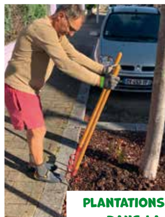
PLANTATIONS SOUS LES ARBRES DANS LA RUE PRINCIPALE