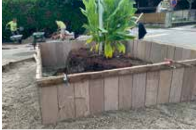
CRÉATION D'UN MASSIF DEVANT LA SALLE DES FÊTES