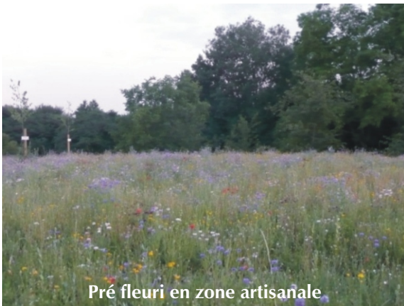
Pré fleuri en zone artisanale

Kunheim a largement adhéré à l'opération «pré fleuri» lancée par le SIVOM du Pays de Brisach. En effet, plusieurs parcelles ont étéensemencées rue du Giessen, entrées nord et sud ainsi qu'en zone artisanale. Cette opération sera reconduite l'an prochain.