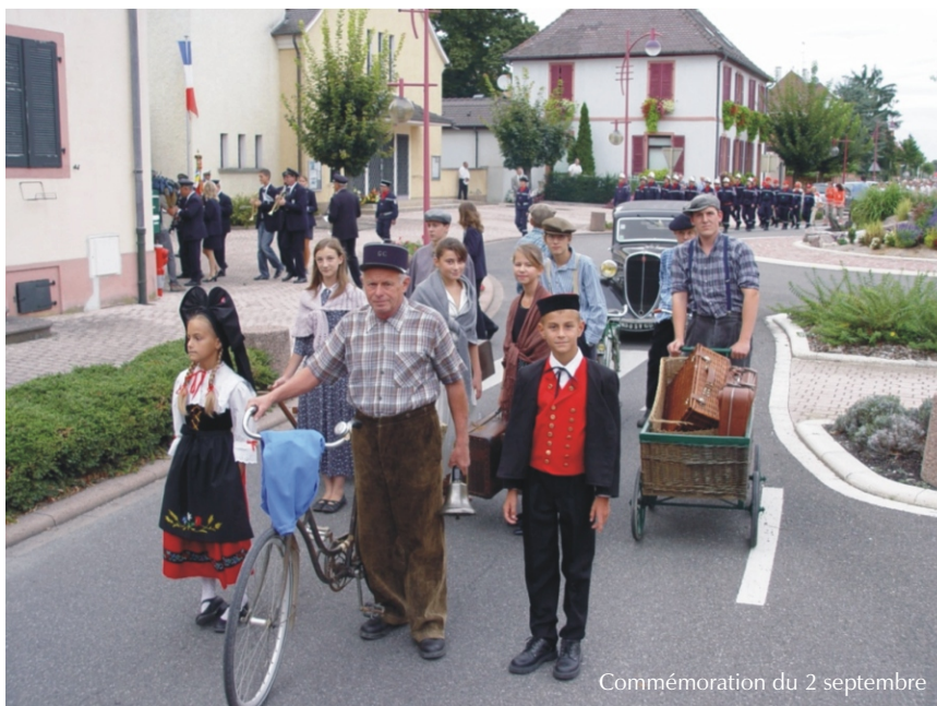
Commémoration du 2 septembre