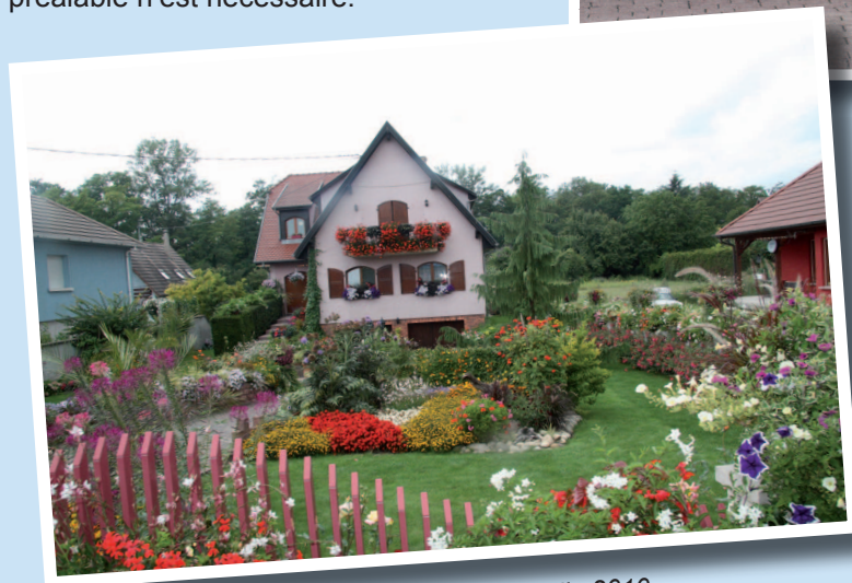
1 er prix maisons avec jardin 2010