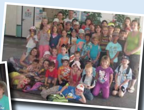
Sortie à la piscine Sirenia