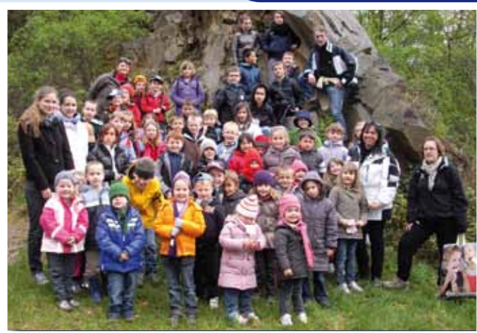
Au printemps, petits et grands ont visité le Haut-Koenigsbourg et la Volerie des Aigles

Ensuite, du 30 juillet au 3 août, la caravane de l'AIREL fera station au camping de l'île du Rhin et à Kunheim. Nous nous mettrons dans la peau des nomades du Sa-