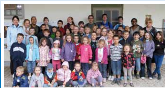
Sortie au Mundenhof durant l'ALSH de printemps

N'hésitez pas à prendre contact avec la présidente. Merci !