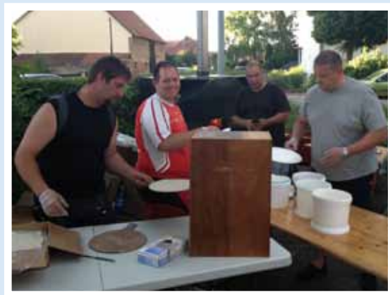
Cuisson des tartes flambées à la fête de la musique

Quelques Jeunes Sapeurs-Pompiers de Kunheim sont partis avec la Section du Bassin Rhénan du 7 au 11 mai à la rencontre des Jeunes Sapeurs-Pompiers de Cancon dans le Lot et Garonne.