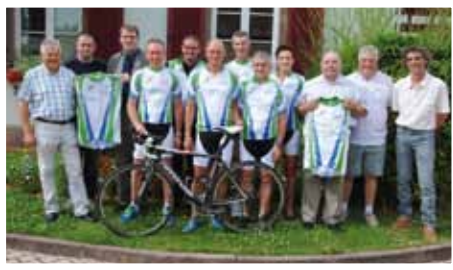
Remise des maillots avec des représentants du Crédit Mutuel et de Dessindus