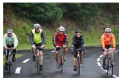
Ascension vers Besse dans le massif du Sancy (Auvergne) : altitude 1200 m