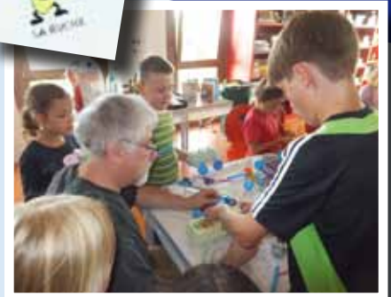
Durant l'ALSH d'été :