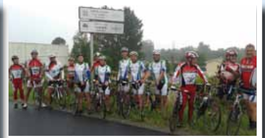
Pour les derniers kilomètres avant l'arrivée, le club des cyclistes de Casteljaloux a accompagné les kunheimois

Un projet cycliste, soutenu par la commune et par 2 partenaires, a permis à 5 cyclistes kunheimois de rejoindre Casteljaloux cet été.