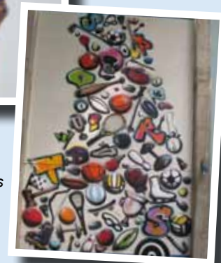
Réalisations supplémentaires : Deux grands graffitis décorent désormais la salle des sports.