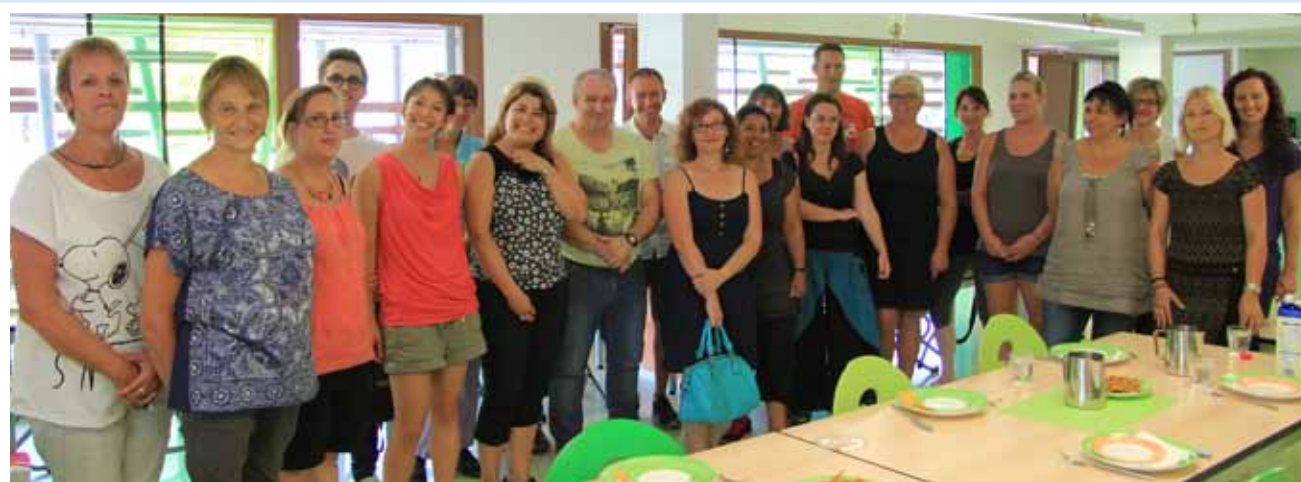
Enseignants, ATSEM, animateurs du périscolaire, élus et agents lors de la pré-rentrée