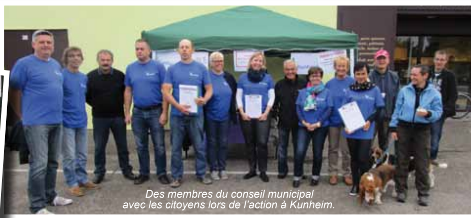
Des membres du conseil municipal avec les citoyens lors de l'action à Kunheim.