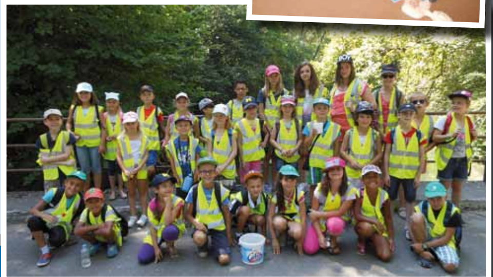
Sortie nature à la découverte de la faune et de la flore