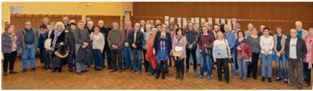
Les lauréats des maisons fleuries 2018 avec les propriétaires des jardins ouverts et des élus.

La soirée de remise des prix « maisons fleuries 2018 » a eu lieu le 15 mars à la salle des fêtes. 50 jardiniers amateurs ont été récompensés pour le fleurissement de l'été dernier dont 3 dans la catégorie balcon. Le classement 2018 s'étalait de 1 à 5 fleurs. Les lauréats ont reçu un bon d'achat et des plantes de printemps de l'horticulture Ambiel à Vogelgrun.