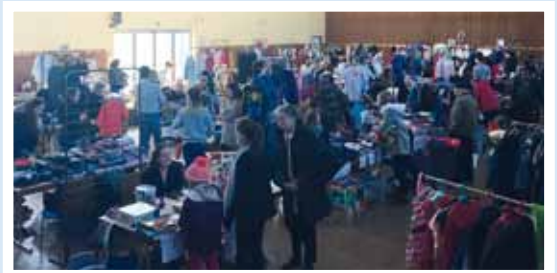
Cette année, la bourse aux vêtements a rencontré à nouveau un franc succès. Grâce à l'argent récolté lors des manifestations, du matériel de motricité a pu être acheté.

Cet argent a permis de financer l'achat de gros matériel pour la salle de motricité des enfants : des matelas mousse, une glissière, un tunnel, des plots... Merci à tous les parents et toutes les personnes qui nous soutiennent et participent régulièrement à nos manifestations.