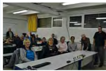
Adhérents et élus lors de la soirée de présentation

Par ailleurs, une aide aux démarches administratives aura lieu tous les premiers jeudis de chaque trimestre.