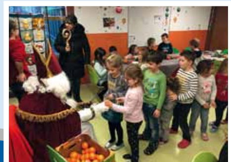
Passage du Saint Nicolas à La Ruche