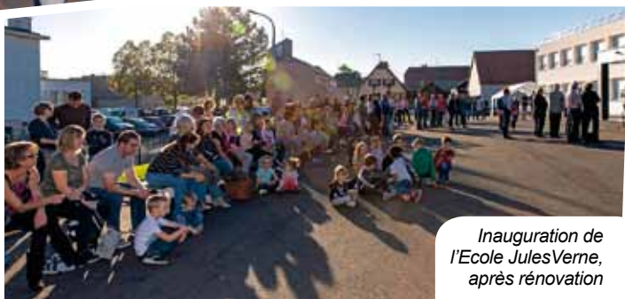
Inauguration de l'Ecole Jules Verne, après rénovation