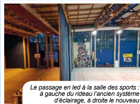
Le passage en led à la salle des sports : à gauche du rideau l'ancien système d'éclairage, à droite le nouveau