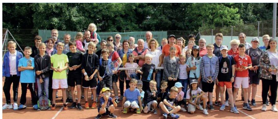
▼ Les jeunes de l'école de tennis 2017/2018, lors de la fête de fin de saison en juin