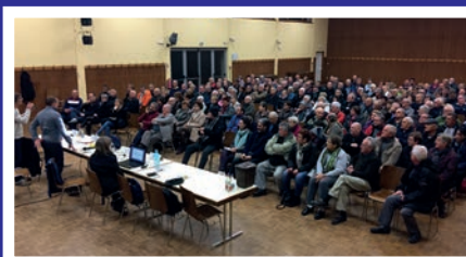
Salle comble à la réunion d'information, fin novembre à la salle des fêtes

Pour toute question concernant les déchets urbains, la nouvelle redevance incitative et les bacs, veuillez contacter le service de gestion des déchets de la Communauté de Communes Pays Rhin Brisach au 03 89 72 56 49. Courriel : dechets@paysrhinbrisach.fr