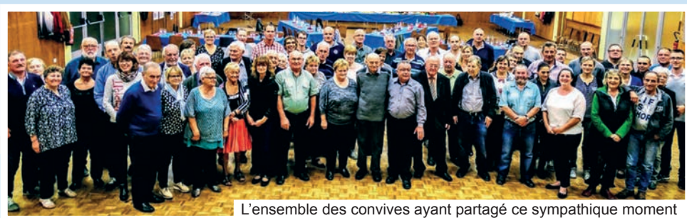
L'ensemble des convives ayant partagé ce sympathique moment