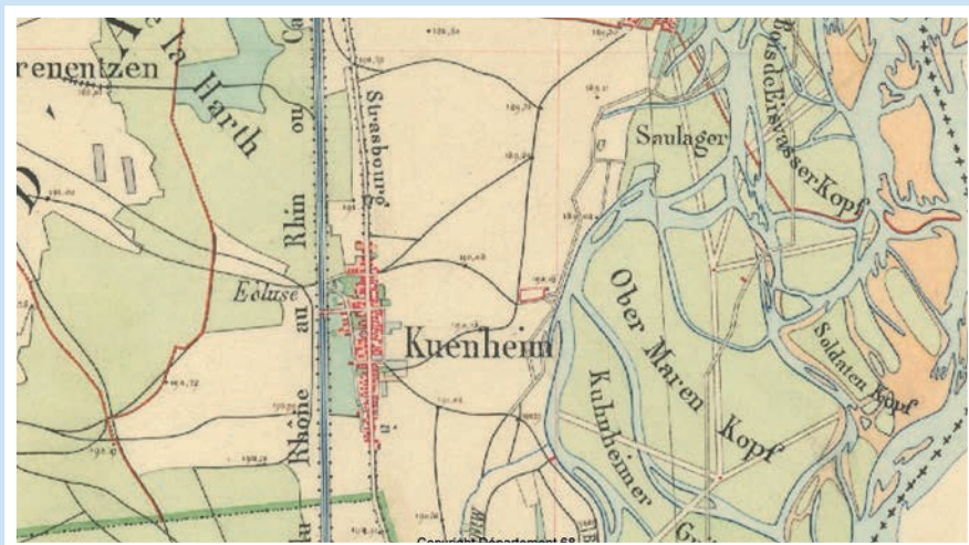
Kunheim en 1840 – 731 habitants au recensement de 1846

La vie à Kunheim a toujours été influencée par le Rhin. C'est ainsi que des îles du Rhin, protégées des inondations par la digue des hautes eaux de Tulla, avaient trouvé une vocation agricole avant d'accueillir une zone industrielle prospère.