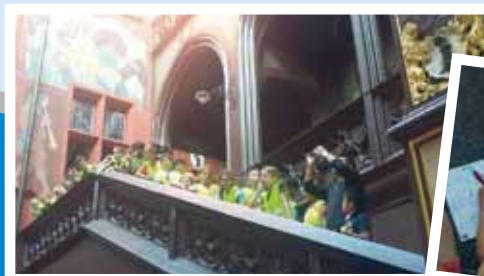
A la découverte de Bâle