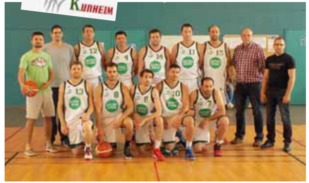
L'équipe seniors hommes 1 termine vice-championne du Haut-Rhin et accède pour la 2 ème année consécutive à la division supérieure