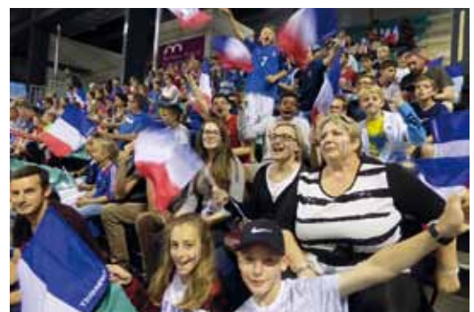
Sortie de fin d'année au palais des sports de Mulhouse : match de l'équipe de France de basket féminin