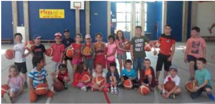
Opération basket école : 6 séances de basket pour chaque écolier de Kunheim. Merci aux 6 bénévoles qui ont effectué près de 335 heures !