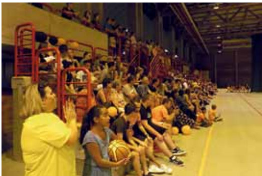
Une salle des sports comble lors des finales départementales les 27 et 28 mai. Le BCK était chargé de l'organisation