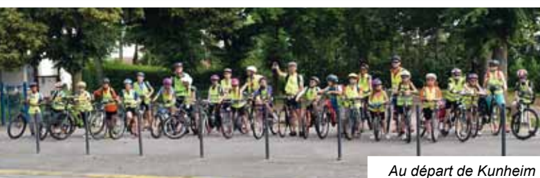
Au départ de Kunheim

Les élèves de CE2, CM1 et CM2 bilingues de l'école Jules Verne ont fait un voyage de 4 jours à vélo. Leur itinéraire les a menés de Kunheim à Bâle, puis Lörrach et Freiburg im Breisgau avant de rentrer chez eux. Les enfants ont pu profiter des beaux paysages de la plaine du Rhin, de l'écluse de Niffer, d'une visite touristique de Bâle à pied et en tram et d'une découverte du musée Tinguely. L'étape entre Lörrach et Freiburg a été parcourue avec bravoure et dans un esprit sportif malgré les nombreuses collines. Les soirées en auberge de jeunesse ont laissé place à la détente, aux jeux et aux veillées musicales. Un défi réussi et des bons moments qui resteront gravés pour toujours dans les têtes des enfants.